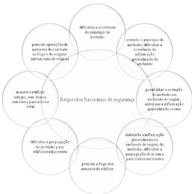
Figura 3: Requisitos funcionais de segurança para obtenção de um projeto eficaz na proteção contra incêndio

A Figura 3 foi elaborada com a intenção de demonstrar a relação dos requisitos funcionais que, de acordo com Seito et al. (2008), devem ser contemplados no processo produtivo e no uso do edifício para extinguir os riscos. A partir da garantia do atendimento aos requisitos funcionais obtém-se o chamado Sistema Global de Segurança Contra Incêndio.